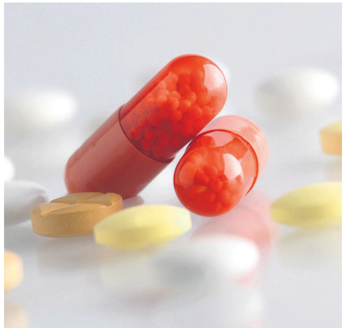
Die Schweizer Preise für Generika sind doppelt so hoch wie in der EU.

Laut der Studie schaffe aber die EWR-Mitgliedschaft die Möglichkeit, Liechtenstein am europäischen Arzneimittelmarkt anzubinden. Dadurch könnten theoretisch die Gesundheitskosten aufgrund von günstigeren Preisen gesenkt werden. Denn die Schweizer Preise sind zumindest für Generika rund doppelt so hoch wie in der EU. Bei Originalpräparaten halten sich die Kosten die Waage. Zudem würde aufgrund des Anschlusses ans europäische Netz die Medikamentenpalette vergrössert und damit eine bessere Arznei-